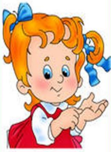
1. Закатываем рукава