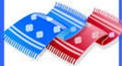
8. Вытираем руки