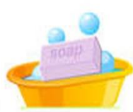
3. Берём мыло.