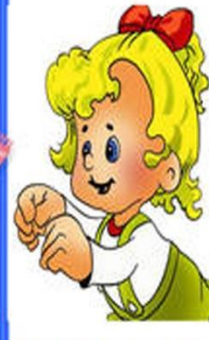
9. Опускаем рукава