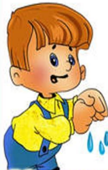
7. Отжимаем руки