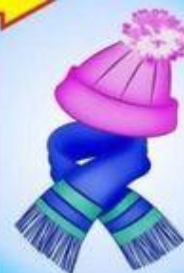
ШАПКА И ШАРФ