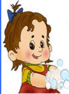
4. Намыливаем руки