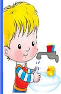
5. Моем руки