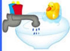
2. Открываем кран