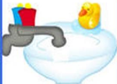
6. Закрываем кран